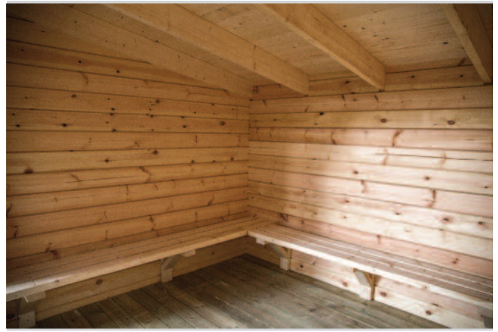
Laftet i vakker svensk furu