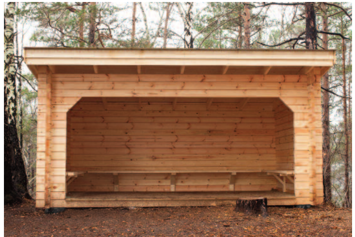
Enkelt og stilrent design